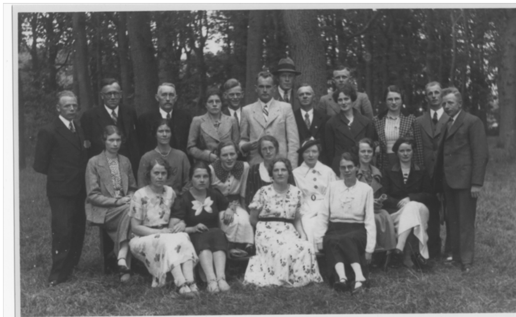
Gemengd koor Leens